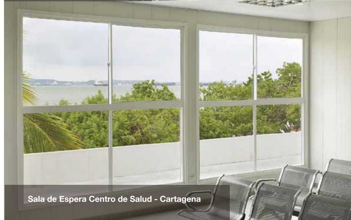
Sala de Espera Centro de Salud - Cartagena