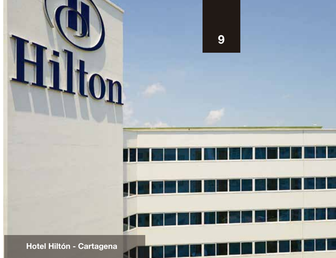
Hotel Hilton - Cartagena