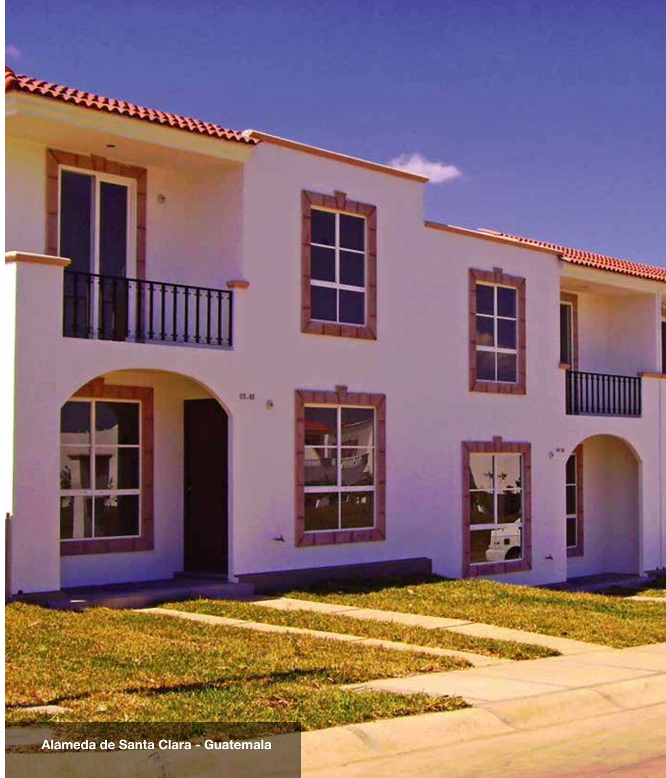
Alameda de Santa Clara - Guatemala